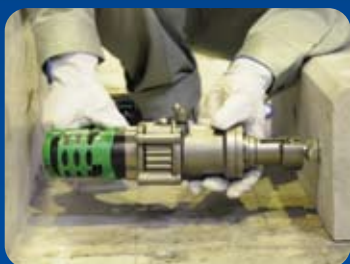
▶ 狭い場所でも施工可能