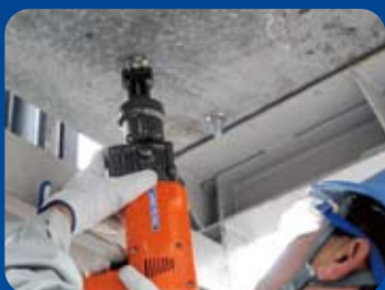
▶ 天井もらくらく施工