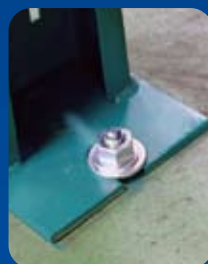
▶ ねじ部損傷もなく、打ち損じもない